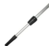
Teleskopstiel Alu ausziehbar